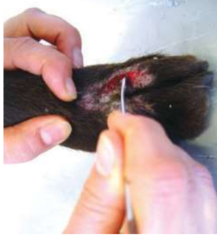
Het nemen van een huidafkrabsel 5

De algehele gezondheid van het dier moet beoordeeld worden met speciale aandacht voor aandoeningen die het immuunsysteem kunnen onderdrukken. Hieronder vallen een slechte verzorging, inadequate voeding, endoparasieten en onderliggende aandoeningen. Om een toename in prevalentie van canine demodicose te voorkomen wordt geadviseerd om niet te fokken met een hond met gegeneraliseerde demodicose en getroffen dieren te castreren/steriliseren.