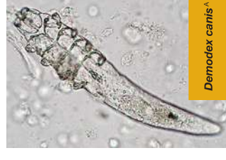
Demodex canis A