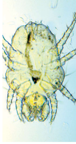
Volwassen Cheyletiella mijt c