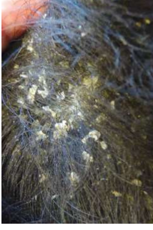
Wandelende roos 3