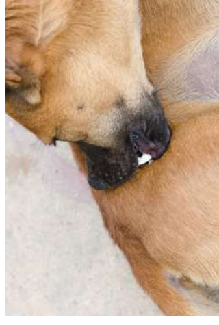
Dieren kunnen zich overmatig wassen