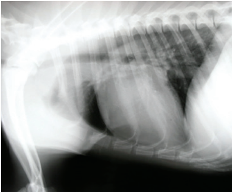
Hartworminfectie veroorzaakt longproblemen

Zonder behandeling kan het ziektebeeld verergeren en resulteren in rechter hartfalen en sterfte. Bij de kat verloopt de infectie vaak asymptomatisch, maar kan ook leiden tot acute sterfte.