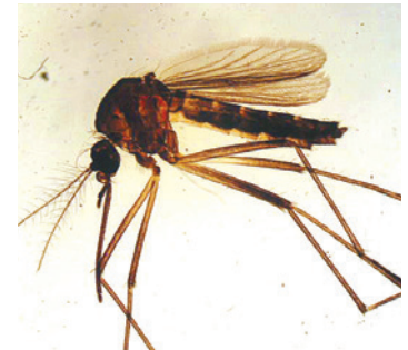
Hartworm wordt meestal overgedragen door verschillende soorten muggen