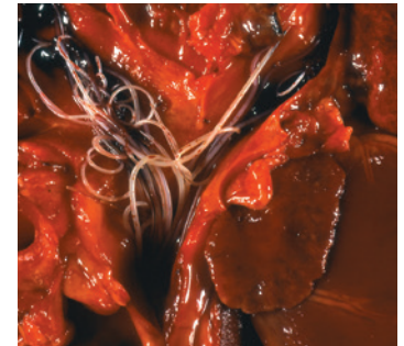
Volwassen wormen leven in de longarteriën