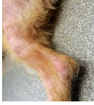
Sarcoptes schurft B